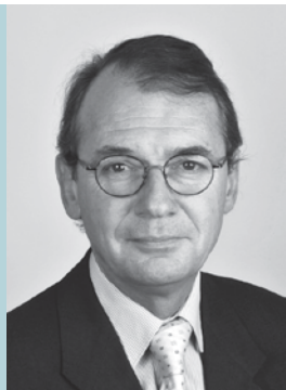
Verleger: Dominique-Charles R. Oppler

Jene Bilder, deren Bildrechte für Open Access nicht zur Verfügung stehen, sind bei der Open-Access-Publikation nicht sichtbar. Ein Platzhalter trägt dann den Vermerk: OA-rights not available . Damit die Bilder einsehbar sind, muss das Buch als Printversion erworben werden.